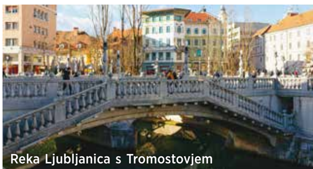
Reka Ljubljanica s Tromostovjem

Poleg Prešernovega trga sta si naša popotnika ogledala še nekaj znamenitosti.