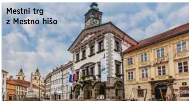
Mestni trg z Mestno hišo