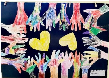
Slika 6: Spodbujamo prijateljstvo 2022/23 - Žogice

V času zaprtja dislociranih enot zavod zagotavlja varstvo v matični enoti Storžek.