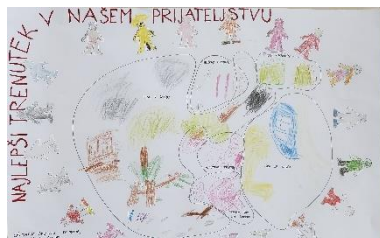
Slika 1: Spodbujamo prijateljstvo 2022/23 - Račke