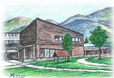
Vrtec Storžek, Preddvor Ustanoviteljica občina Preddvor

Vrtec deluje v okviru OŠ Matije Valjavca Preddvor in ima 4 lokacijsko ločene enote.