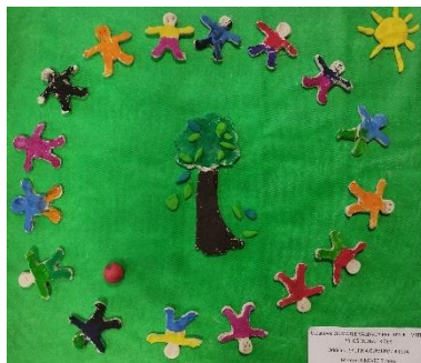
Slika 5: Spodbujamo prijateljstvo 2022/23 - Gumbki

Odsotnost vašega otroka zaradi bolezni oz. kakšnega drugega vzroka sporočite preko eAsistenta do 8. ure zjutraj (od kdaj do kdaj bo predvidoma otrok odsoten iz vrtca). Podrobna navodila, uporabniško ime in geslo starši dobijo na naslov elektronske pošte, ki so jo navedli v vlogi za vpis otroka v vrtec.