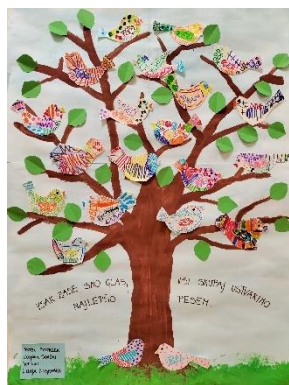
Slika 2: Spodbujamo prijateljstvo 2022/23 - Sončki

Ob morebitnih odstopanjih in izraženih težavah se, izhajajoč iz opazovanja, individualnega pogovora, prilagajanja in pomoči vzgojitelja otroku, v oddelek vključi še svetovalna delavka. Na podlagi pisnega soglasja, se skupaj dogovorimo za možne oblike pomoči in prilagoditev, ki jih otrok potrebuje za optimalen razvoj na vseh področjih.