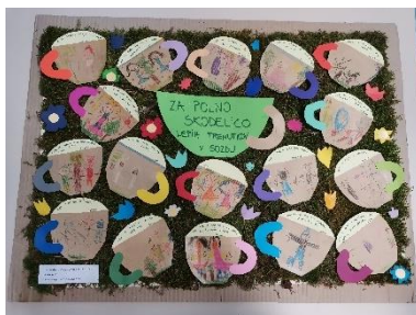
Slika 4: Spodbujamo prijateljstvo 2022/23 - Knofki

Ko ne boste prepričani ali otrok sodi v vrtec ali ne, poiščite pomoč pri izbranem osebnem zdravniku – pediatru. Informacije o nekaterih boleznih in priporočilih lahko najdete tudi na spletni strani Nacionalnega inštituta za zdravje (NIJZ), kjer je v dokumentu opisanih večina otroških bolezni. Dokument najdete spletni strani vrtca, v zavihku Zdravje in prehrana .