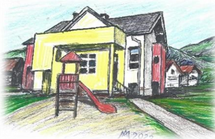
Vrtec Čriček, Zg. Bela Ustanoviteljica občina Preddvor