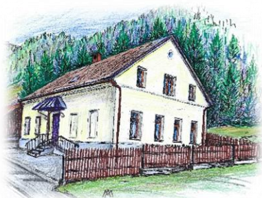
Vrtec Biba, Kokra Ustanoviteljica občina Preddvor