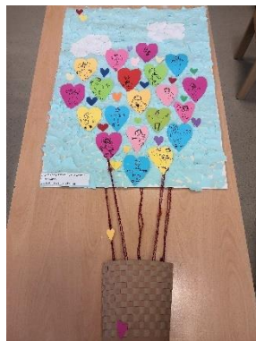
Slika 3: Spodbujamo prijateljstvo 2022/23 - Oblački