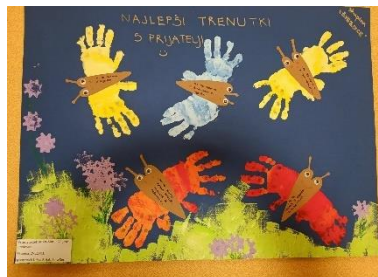
Slika 8: Spodbujamo prijateljstvo 2022/23 - Zvezdice