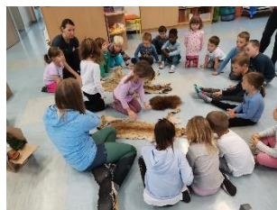
Slika 5: V Knofkih spoznavamo velike zveri, 14. 10. 2023

Vsi otroci imajo v vrtcu pravico do spanja ali počitka. Prehod od kosila do počitka poteka postopoma. Počitek traja glede na individualne otrokove potrebe in ni časovno omejen.