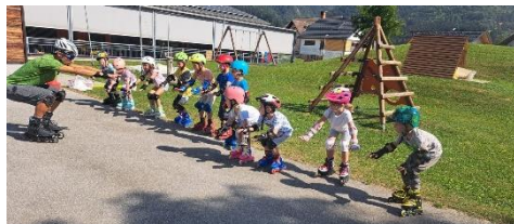
Slika 10: Tečaj rolanja, sept. 2023