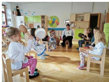
Slika 1: Pravljične urice v Žabicach, dne 13. 10. 2023