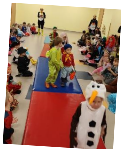
Slika 6: Vesele maskare na rajanju v Preddvorskem vrtcu, 14. 2. 2024