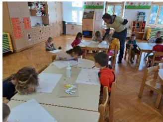
Slika 2: Vedno bodi prijazen. Ne veš kaj se skriva za mojo zgodbo. 24. 4. 2024

Svetovalna delavka je v neposredni povezavi z otroki, starši, strokovnimi delavci, vodstvom vrtca in zavoda ter zunanjimi institucijami, na katero se lahko obrnejo za svetovanje, podporo, usmeritve in nadaljnjo pomoč.