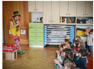
Slika 11: Obisk Pika Nogavičke na Jezerskem, dne 14. 5. 2024

Ob vstopu v vrtec se različni otroci odzovejo različno. Nekateri hitro usvojijo novo rutino in se hitro sprijaznijo s spremembo oz. ločitvijo od staršev, drugi pa potrebujejo več časa, spodbude, potrpljenja in vztrajnosti. Slednji imajo običajno nekoliko več prilagoditvenih težav in ob ločitvi od staršev jokajo, trmarijo, odklanjajo hrano, so nemirni ali so drugače občutljivi, lahko celo pride do bolezenskega stanja. Takšne težave lahko hitro minejo, občasno pa vztrajajo do enega meseca. S tem ko mu nudite