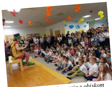
Slika 13: Storžkov ringaraja z obiskom Pika Nogavičke, dne 31. 5. 2024