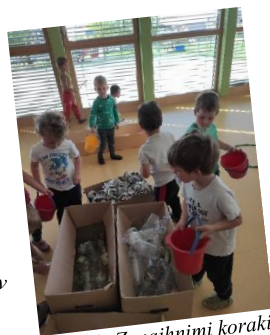
Slika 8: Z majhnimi koraki do lepšega sveta. Svetovni dan Zemlje, dne 22. 4. 2024