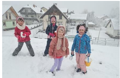
Slika 4: Težko pričakovan sneg! 19. 1. 2024

Ko ne boste prepričani ali otrok sodi v vrtnice ali ne, poiščite pomoč pri izbranem osebnem zdravniku – pediatru. Informacije o nekaterih boleznih in priporočilih lahko najdete tudi na spletni strani Nacionalnega inštituta za zdravje (NIJZ), kjer je v dokumentu opisanih večina otroških bolezni. Dokument najdete spletni strani vrtnice, v zavihku Zdravje in prehrana .