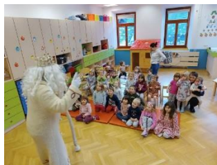
Slika 16: Obisk dedka Mraza, dec2023