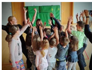
Slika 12: Projekt Igrajmo se, spoznajmo se