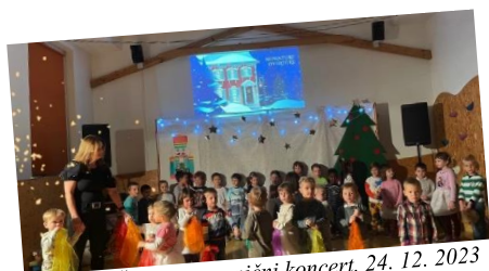
Slika 19: Čričkov praznični koncert, 24. 12. 2023