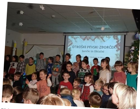
Slika 15: Zimska pravljica o prijaznosti, dne 15. 12. 2024