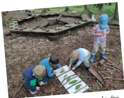
Slika 18: Dinozavri in Zvezdice v gozdu, dne 5. 6. 2024