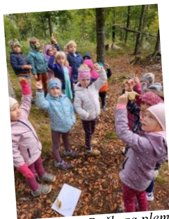
Slika 7: Uganke Račk za plemo iglavcev in listavcev, 17. 11. 2023

V času zaprtja dislociranih enot zavod zagotavlja varstvo v matični enoti Storžek.